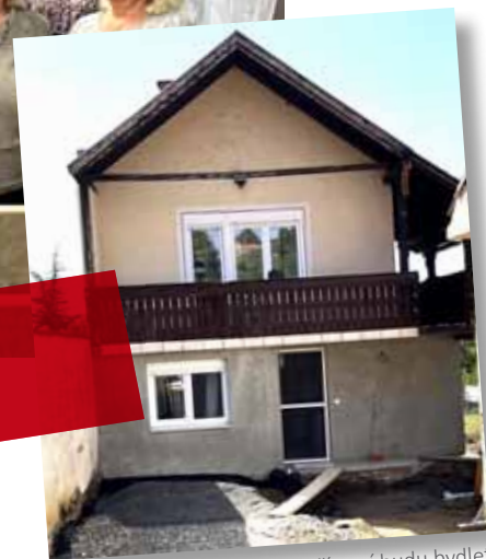
Zde v přízemí budu bydlet.