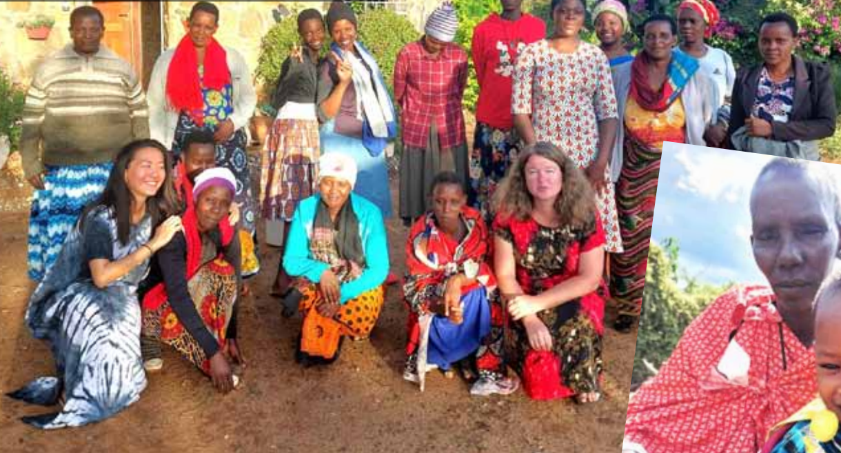
Setkání žen pracujících v misii.