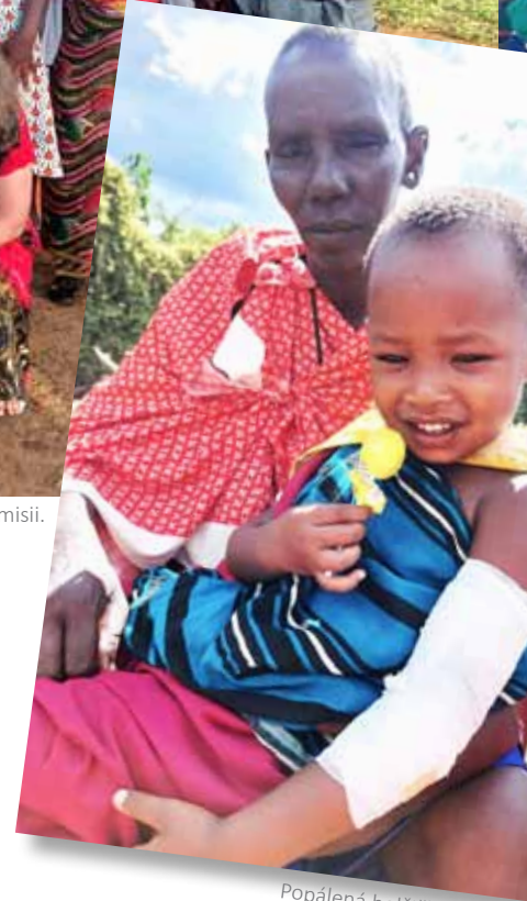
Popálená holčička v Gilo.