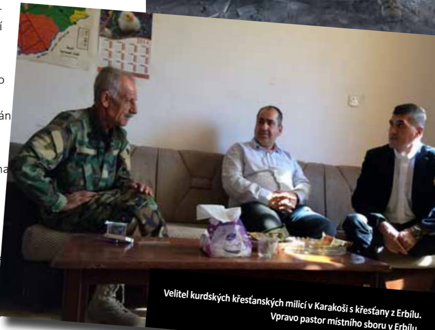
Velitel kurdských křesťanských milic v Karakoši s křesťany z Erbilu. Vpravo pastor místního sboru v Erbilu.

upřímnou touhu po duchovní obnově a hledání Božího království v tomto čase, kdy museli opustit svůj domov a zachránit si holý život. Nezapomínejme také, že křesťanství v této části světa má mnohem hlubší kořeny než například u nás. ■