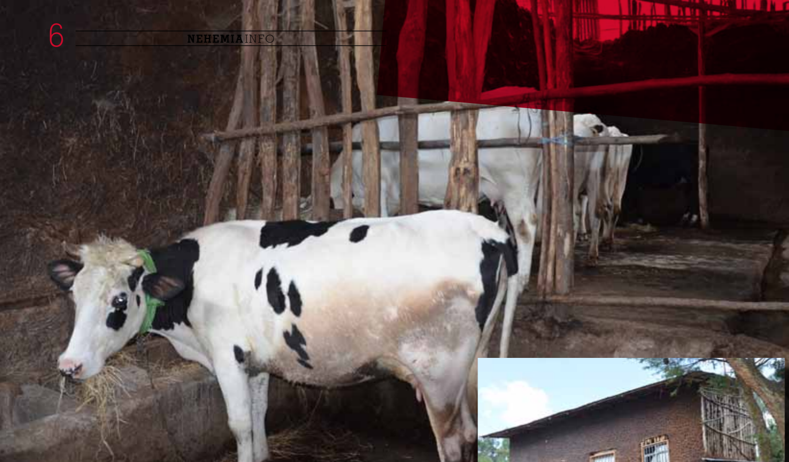
Nahoře chlév pro krávy. Vpravo budova správce, který se věrně o krávy stará.